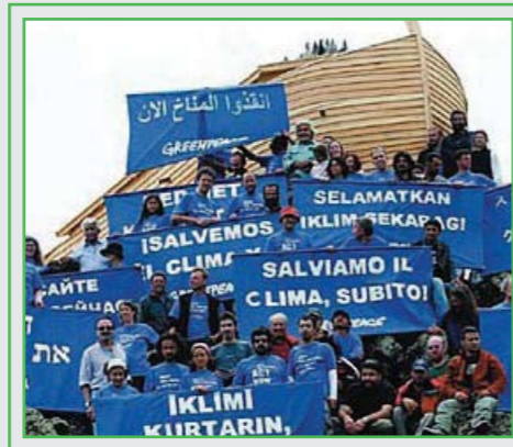
פעילות בין-לאומית בנושא שינויי האקלים