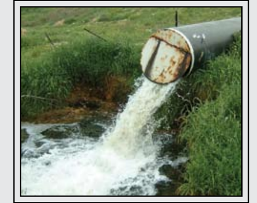
זיהום נחל במי ביוז