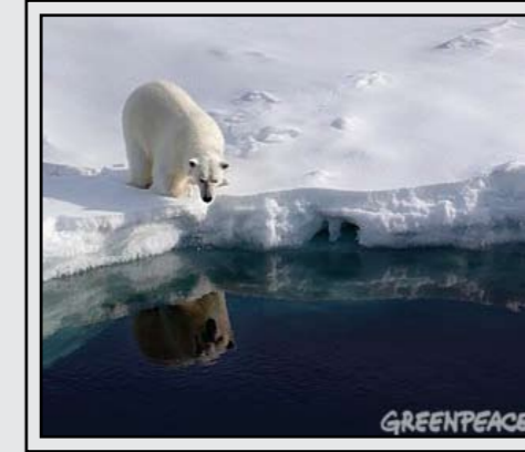
הפשרת קרחונים באזורי הקוטב