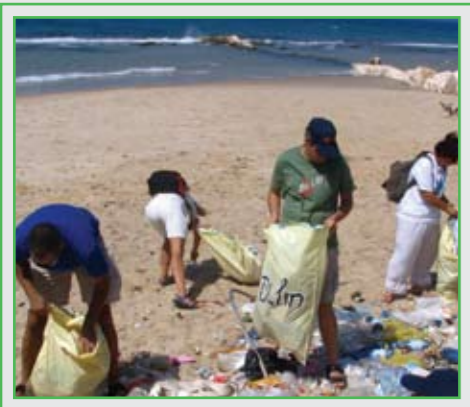
מבצע ניקיון בחוף הים